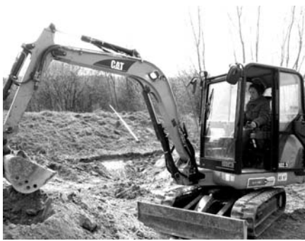
Comme le prouvent ces photo, tout est réalisable par une femme seule.

En hiver 2002/2003, les Espaces Chico Mendès de Hondeghem, Boussois et Bourghelles ont accueilli un nouveau lieu de vie : une mare (voire deux). Sur ces sites perméables, il s'agit à chaque fois de mares artificielles, donc bâchées, illustrées par le petit photo-reportage suivant :