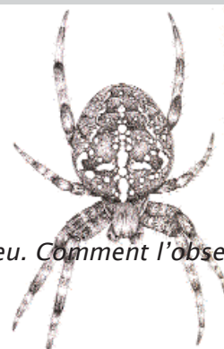
Epeira diadème - La Hulotte